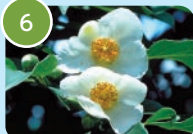
ナツツバキ (シャラノキ)