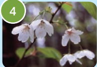
カスミザクラ (ケヤマザクラ)