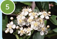
カマツカ (ウシコロシ)